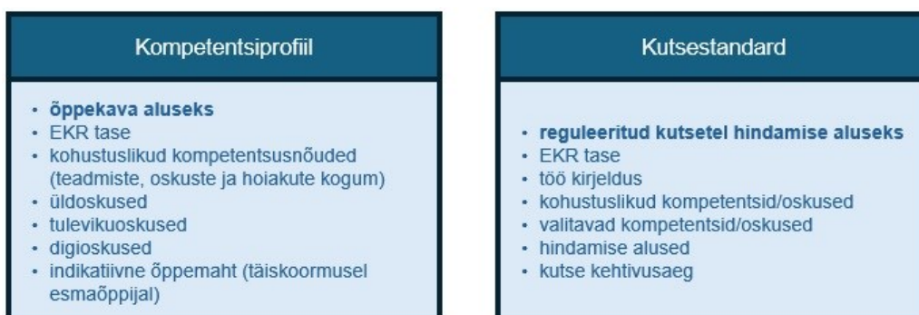
Joonis 4. Kompetentsiprofiili ja kutsestandardi osised.

Kompetentsiprofiilidele kavandatakse lisada ka indikatiivsed õppemahud (arvestuspunktid) ehk kui kaua kulub täiskoormusega õppides töökogemusega tavaõppijal oskuste omandamiseks aega. Kokkulepitud mahuindikatsioon võimaldab vähendada ebaselgeid olukordi, kus samade õpiväljunditega kvalifikatsiooni on võimalik samal ajal pakkuda või omandada pelgalt tundidega või siis mitme aastaga.