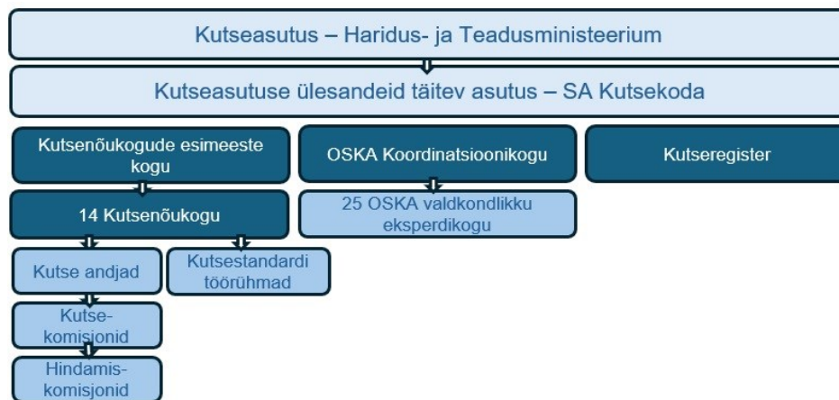
Joonis 1. Kutseüsteemi osapooled

Kutseüsteemi arendamise ja rakendamise korraldamise ülesanne on seaduse kohaselt kutseasutusel, milleks on Haridus- ja Teadusministeerium ( edaspidi HTM). Kutseasutuse ülesannete täitmine on volitatud SA-le Kutsekoda .